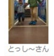
大武さん 「We love 緑地」 汐入下水道横緑地