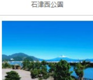
沼野さん 「海辺の展望台からの眺望」 ふいしゅーな